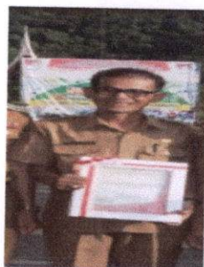
Gambar 3.2 Penyerahan Laporan Re-asessment Tingkat Maturitas Sistem Pengendalian Intern Pemerintah (SPIP) Kabupaten Pesisir Selatan Tahun 2018

Penyerahan Laporan Re-asessment Tingkat Maturitas Sistem Pengendalian Intern Pemerintah (SPIP) Kabupaten Pesisir Selatan Tahun 2018, dapat dilihat pada Gambar 3.2 berikut ini;